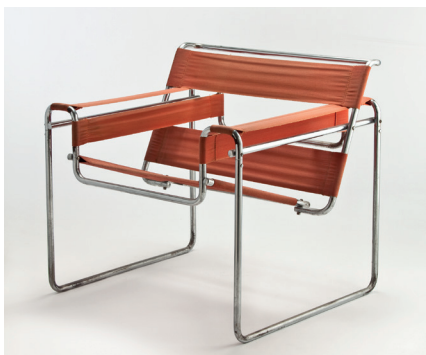
MARCEL BREUER, Armlehnstuhl B3 „Wassily“, Dessau, 1925-27, Inv.Nr.: DL54