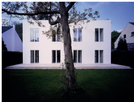
O.M. UNGERS, Haus Ungers III, Köln 1994–1996

Sa., 20. und So., 21.6., jeweils 15 Uhr, Details siehe Vorderseite