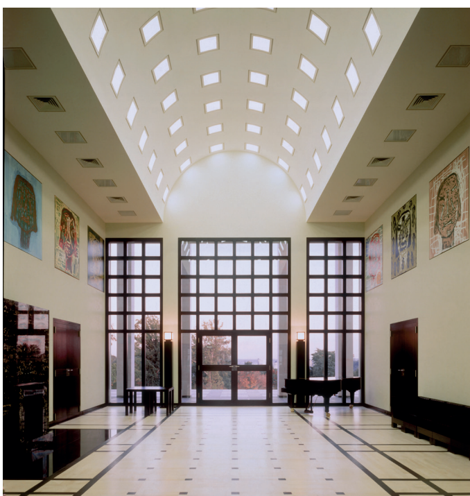
O.M. UNGERS, Residenz des Deutschen Botschafters, Washington, D.C. 1987-1995