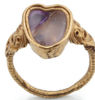
Fingerring, hellenistisch, 3.–2. Jh. v. Chr., GIOTY