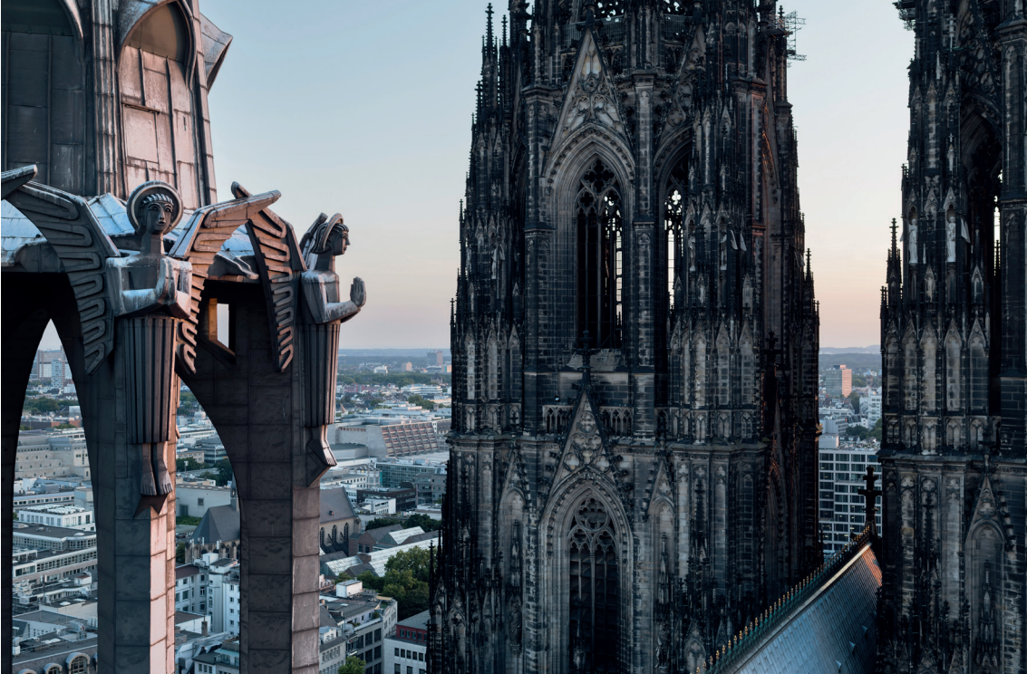
Hohe Domkirche zu Köln, Vierungsturm, Köln 2025