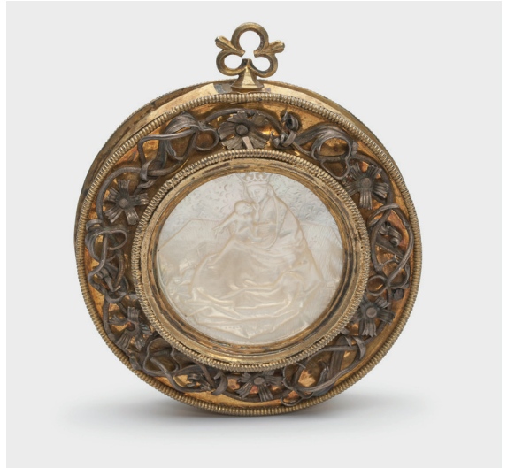
Anonym, Pax-Anhänger, Deutschland, frühes 16. Jh.

Faszination Schmuck. 7.000 Jahre Schmuckkunst im MAKK Anja Reincke | Museumsdienst Köln Teilnahme kostenlos über Big Blue Button Link zur Konferenz über www.makk.de/Kalender