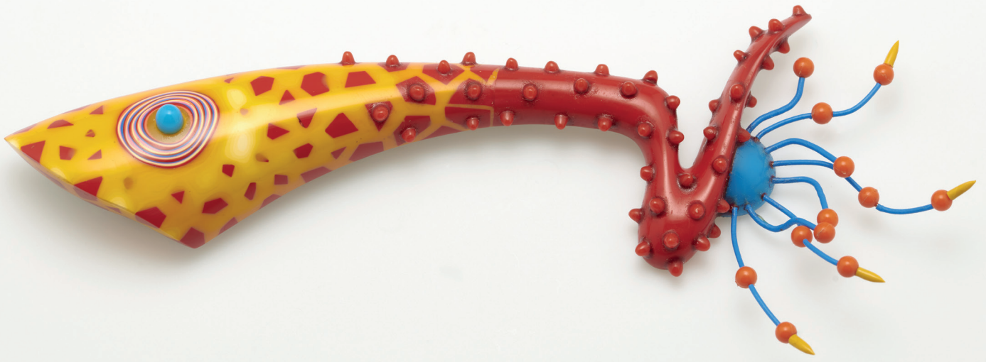
© PETER CHANG, Brosche, Glasgow (Schottland), 1995