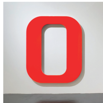
Total Object 347 © GEROLD MILLER & VAN HORN, Düsseldorf

Am 10. Januar ist es wieder so weit: Die PASSAGEN eröffnen die internationale Designsaison und laden zu den Shows von Designer*innen und zum Entdecken der Kölner Kreativ-Quartiere ein. Seit 1990 findet das Design-festival statt, so auch 2025, obwohl die Internationale Möbelmesse (imm) Köln kurzfristig abgesagt wurde. Mit der neuen Ausstellung „Faszination Schmuck“ liegt auch zu den PASSAGEN der Fokus im MAKK auf Schmuckdesign. Vom 10. bis zum 16. Januar genießen Besucher*innen freien Eintritt in alle Ausstellungen. Zudem ist das Museum auch am Montag, den 13. Januar von 10 bis 18 Uhr geöffnet.