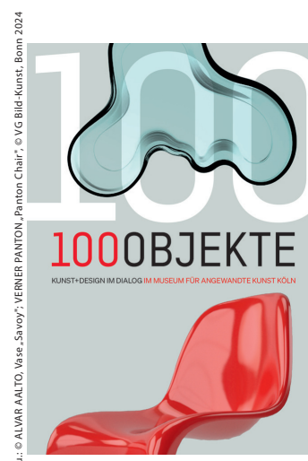
v.o.n.u.: © ALVARO AALTO, Vase „savoy“, VERNER PANTON, „Panton Chair“, © VG Bild-Kunst, Bonn 2024

Die Highlights der Ausstellung „Kunst + Design im Dialog“ sind in dieser Publikation präsentiert. Jedem der 100 Objekte ist eine Doppelseite gewidmet: mit einem Text der Kuratorin Romana Rebbel und sowie einer ganzseitigen Abbildung. Aufgrund des handlichen Formats – zwischen DIN A5 und DIN A6 – erinnert es an eine Broschüre für die Jackentasche. Die aufwendige Verarbeitung und der Umfang sprechen hingegen für eine kleine Publikation. Hierfür spricht auch die Produktion nach den Kriterien der Nachhaltigkeit. „100 Objekte“ ist ab Januar 2025 im MAKK erhältlich.